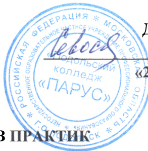
ГРАФИК ПРОВЕДЕНИЯ ВСЕХ ВИДОВ ПРАКТИК по специальности 40.02.01 Право и организация социального обеспечения в 2019 -2020 учебном году